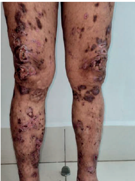
Fig. 1 Paciente con diagnóstico de lepra (Enfermedad de Hansen)