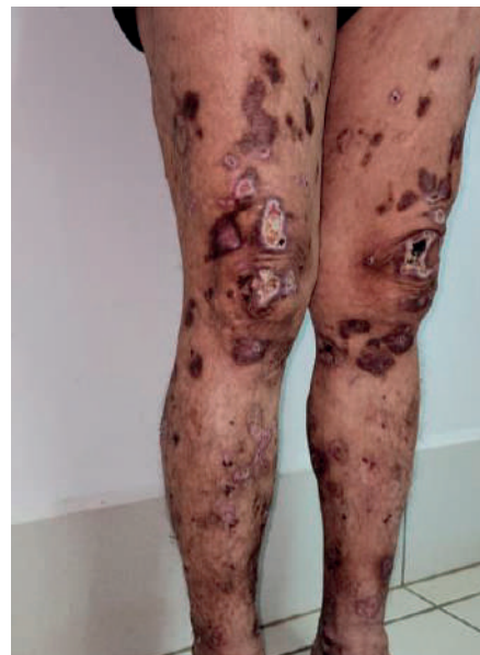
Fig. 2 Paciente a los 6 meses del tratamiento multibacilar