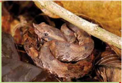
NATILLA, TAMAGAS, COLA BLANCA