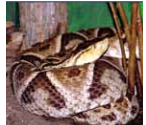
Bothrops asper, familia Viperidae

Son serpientes terrestres y muy agresivas, de tamaño grande que puede llegar a medir hasta 2 metros, se encuentran en lugares boscosos y húmedos.