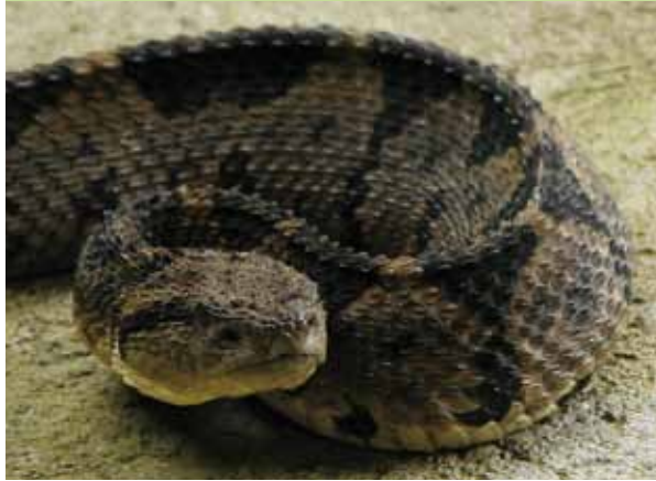
Lachesis muta, familia Viperidae

MATABUEY, CASCABEL MUDA, VERRUGOSA O MASACUATA: Es la serpiente venenosa más grande de todas