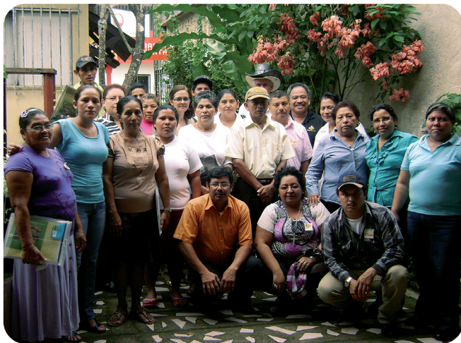
TERAPEUTAS TRADICIONALES DE NUEVA GUINEA