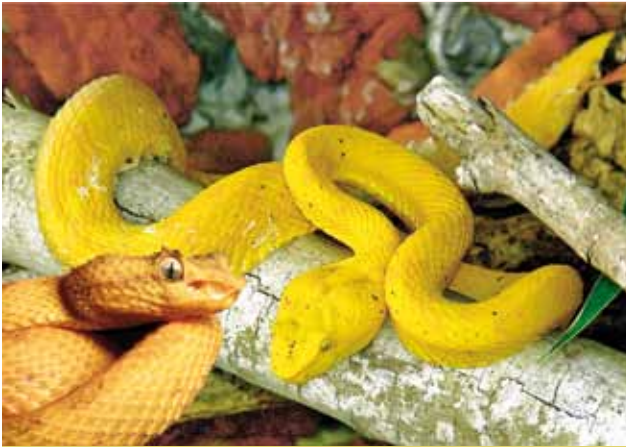
VIBORA DE PESTAÑA, VIBORA DE CACHITO, OROPEL O BOCARACA