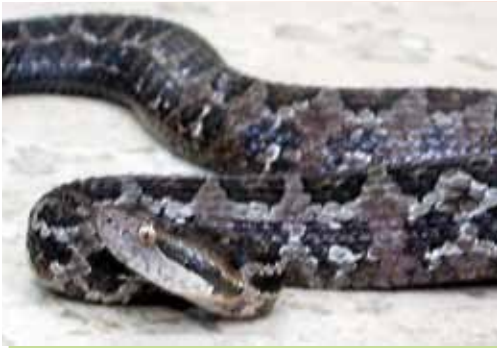
TOBOBA OSCURA, TOBOBITA, ZORCUATA, TRONCA