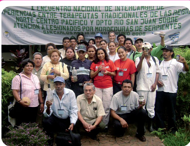
TERAPEUTAS TRADICIONALES DE RIO SAN JUAN