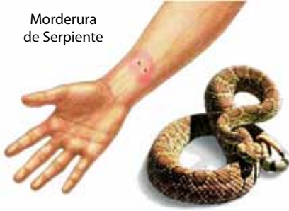
Morderura de Serpiente