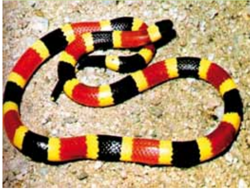
Micrurus nigrocinctus, familia Elapidae

CORALES VERDADEROS: Son serpientes tímidas, están activas de día y de noche, poseen un poderoso veneno que afecta el sistema nervioso.