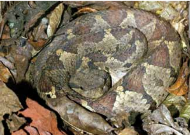
MANO DE PIEDRA, TIMBA, TOBOBA CHINGA O CABEZA DE SAPO