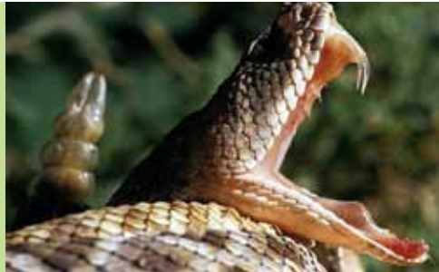
Crotalus durissus , familia Viperidae

Ocupa el segundo lugar en frecuencias de mordeduras